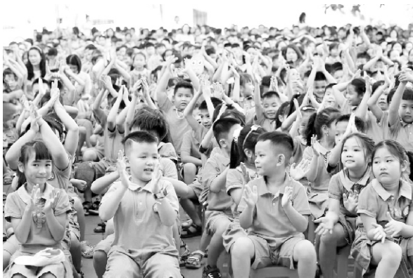
Niềm vui đến trường của học sinh

Phát triển mạng lưới cơ sở giáo dục, tăng cường nguồn lực đầu tư cho giáo dục. Quy mô giáo dục Hải Phòng liên tục phát triển, vững chắc về cơ cấu, đa dạng về loại hình trường lớp. Hiện nay, trên địa bàn thành phố có 316 trường mầm non với 122.744 trẻ; 463 trường phổ thông (tiểu học, THCS, THPT) với 397.946 học sinh; 01 trung tâm Giáo dục thường xuyên thành phố và 14 trung tâm Giáo dục nghề nghiệp – Giáo dục thường xuyên quận/huyện với 8.964 học viên; 17 trường cao đẳng, 10 trường trung cấp, 04 trường đại học; 394 trung tâm ngoại ngữ, tin học, kỹ năng sống, hoạt động ngoài giờ chính khóa; 217 trung tâm học tập cộng đồng. Mạng lưới các cơ sở giáo dục, đào tạo đảm bảo nền tảng để nâng cao dân trí, đào tạo nhân lực và bồi dưỡng nhân tài phục vụ phát triển kinh tế - xã hội của thành phố, góp phần nâng cao chất lượng cuộc sống của nhân dân.