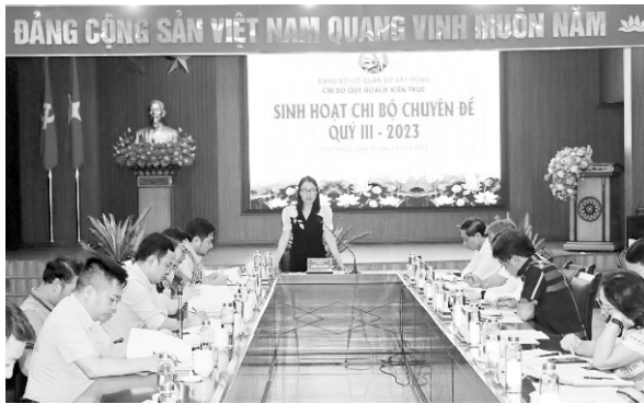
Quang cảnh buổi sinh hoạt chi bộ