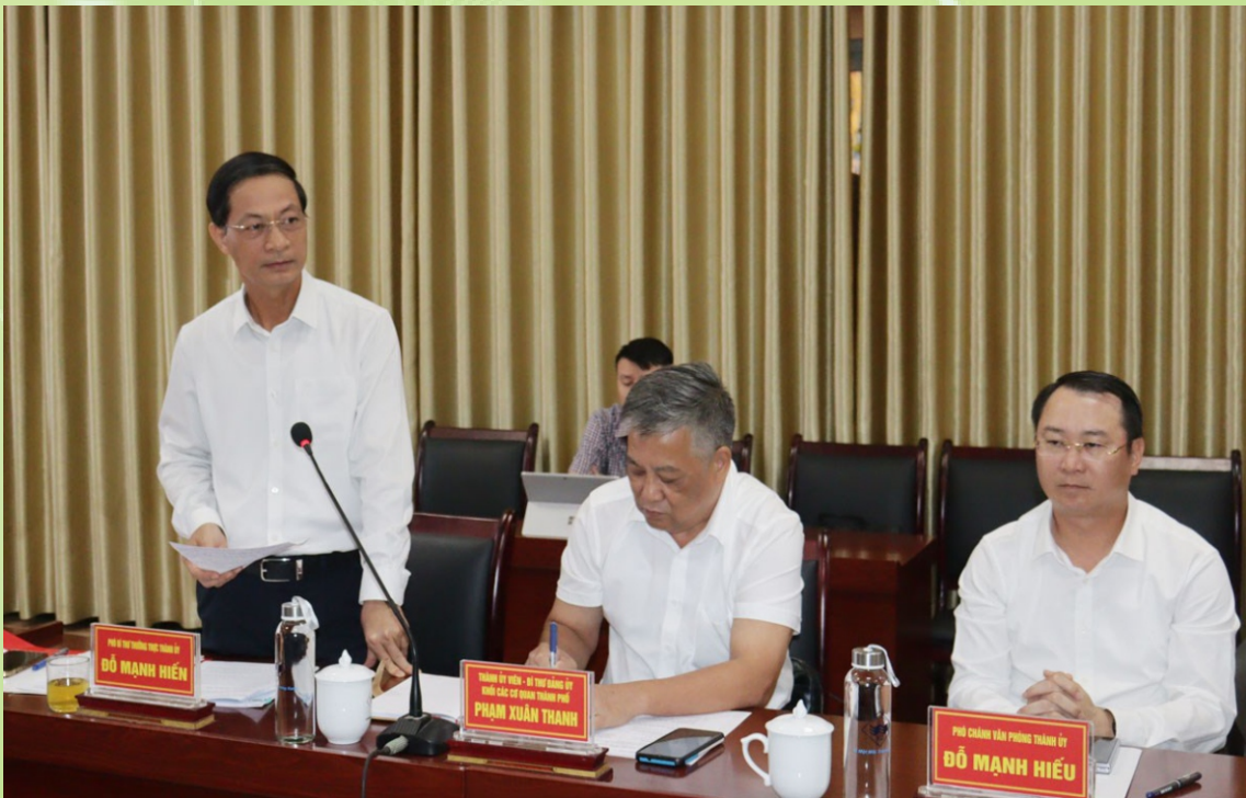
Đồng chí Đỗ Mạnh Hiến, Phó Bí thư Thường trực Thành ủy dự và phát biểu chỉ đạo trong buổi sinh hoạt chi bộ tại Chi bộ Quy hoạch Kiến trúc thuộc Đảng bộ cơ quan Sở Xây dựng