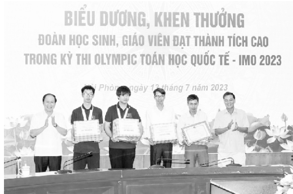
Khen thưởng học sinh đoạt giải Quốc tế

Trong suốt tiến trình cách mạng, Đảng và Nhà nước ta đã luôn khẳng định giáo dục và đào tạo (GDĐT) đóng vai trò then chốt, được ưu tiên trước nhất, thậm chí đi trước một bước so với các chính sách phát triển kinh tế - xã hội khác. Ngay từ Hội nghị Trung ương Đảng lần thứ hai khóa VIII (tháng 12 năm 1996), Đảng ta đã khẳng định: "Thực sự coi giáo dục - đào tạo, là quốc sách hàng đầu. Nhận thức sâu sắc giáo dục - đào tạo cùng với khoa học và công nghệ là nhân tố quyết định tăng trưởng kinh tế và phát triển xã hội, đầu tư cho giáo dục - đào tạo là đầu tư phát triển". Đến Hội nghị lần thứ tám khóa XI (tháng 11 năm 2013), Ban Chấp hành Trung ương Đảng đã ban hành Nghị quyết số 29-NQ/TW về "Đổi mới căn bản, toàn diện giáo dục và đào tạo đáp ứng yêu cầu công nghiệp hóa, hiện đại hóa trong điều kiện kinh tế thị trường định hướng xã hội chủ nghĩa và hội nhập quốc tế" (Nghị quyết 29-NQ/TW). Nghị quyết đã đánh dấu bước phát triển mới về tư duy chiến lược của Đảng đối với sự nghiệp phát triển GDĐT. Quán triệt quan điểm chỉ đạo của Đảng, trong 10 năm thực hiện Nghị quyết 29-NQ/TW, các cấp ủy, chính quyền, ban, ngành đã quan tâm lãnh đạo, chỉ đạo sự nghiệp GDĐT đạt được nhiều tiến bộ, đóng góp tích cực cho phát triển kinh tế - xã hội.