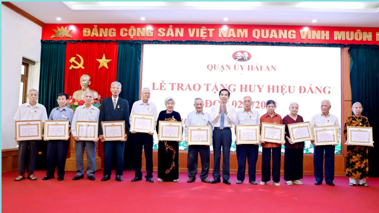
Đồng chí Cao Xuân Liên, Ủy viên Ban Thường vụ Thành ủy, Chủ tịch MTTQ Việt Nam thành phố trao huy hiệu Đảng cho các đảng viên tại quận Hải An dịp 2/9/2023