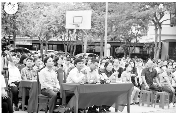
Lãnh đạo Sở GD-ĐT dự cuộc họp phụ huynh đầu năm với THPT An Lão

Giáo dục phổ thông: chất lượng giáo dục hai mặt được duy trì ổn định; tỷ lệ huy động học sinh trong độ tuổi đi học đạt 100%; giảm tỉ lệ lưu ban, bỏ học; tỷ lệ học sinh hoàn thành chương trình tiểu học, học sinh được công nhận tốt nghiệp THCS và THPT liên tục nhiều năm đạt trên 99%. Chú trọng hình thành và phát triển năng lực tự học, tự nghiên cứu, chủ động vận dụng kiến thức vào giải quyết tình huống thực tiễn. Giữ vững vị trí top đầu các tỉnh thành phố về công tác phát hiện và bồi dưỡng học sinh giỏi quốc gia, quốc tế. Từ năm học 2013 - 2014 đến năm học 2022 - 2023, thành phố có 856 giải quốc gia và 13 Huy chương quốc tế các môn văn hóa; 58 giải về Khoa học kỹ thuật quốc gia; 3 dự án Khoa học kỹ thuật đạt giải quốc tế. Trong 4 năm liên tục (2015 - 2018) thành phố đứng thứ 2 toàn quốc về học sinh giỏi quốc gia. Hải Phòng là địa phương duy nhất trên cả nước trong 24 năm liên tục có học sinh đoạt giải quốc tế. Năm 2023, Hải Phòng tiếp tục có 03 học sinh đạt huy chương Vàng và Bạc tại các kỳ thi Olympic quốc tế.